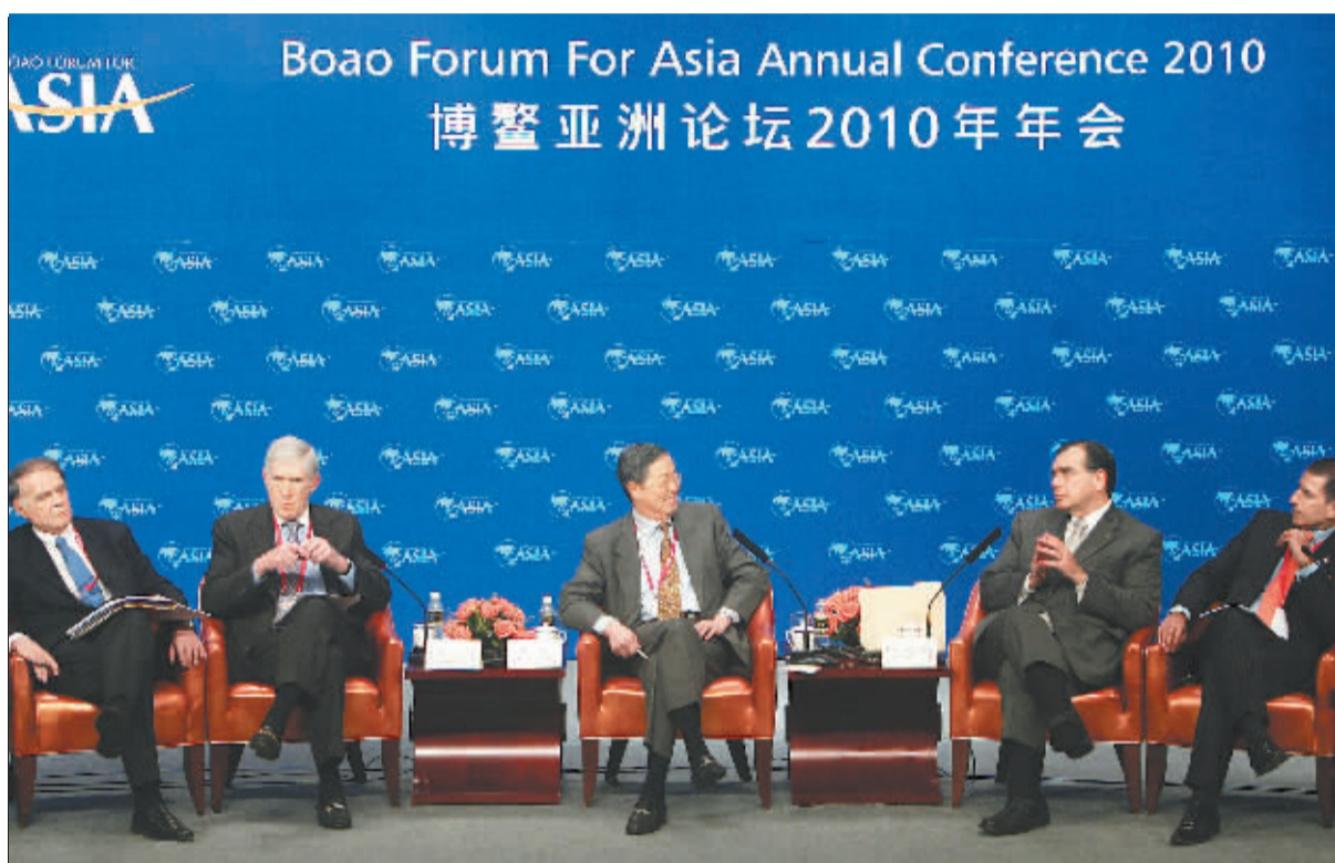
博鳌亚洲论坛 2010 年年会主题论坛“从 G8 到 G20: 全球经济治理新架构、新原则、新力量”会场。

在“从 G8 到 G20”分论坛上,国际经济组织、央行行长、经济学家和企业领袖在主题发言中一致认为,G20 已经成为全球经济治理中的新架构、新原则、新力量,围绕 G20 应该发挥的具体作用,嘉宾分别发表了自己的见解和观点。