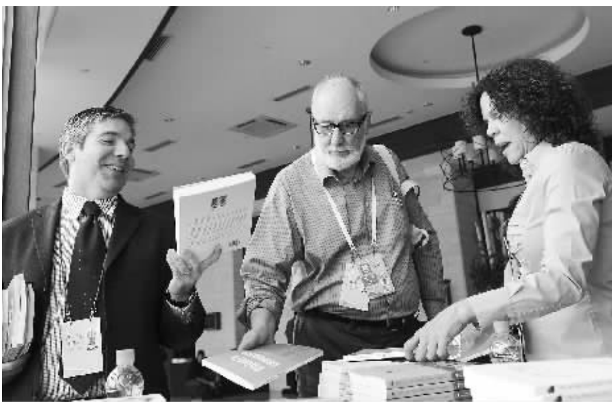
4月14日,参加金砖国家峰会的国外代表对介绍我国传统文化的书籍感兴趣。