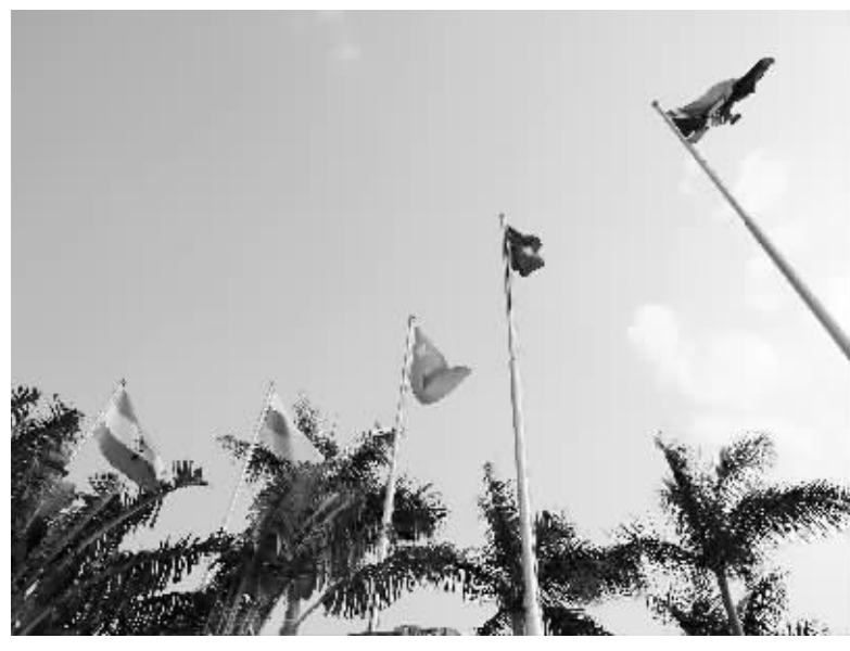
在装扮一新的亚龙湾,金砖五国的国旗在飘扬。