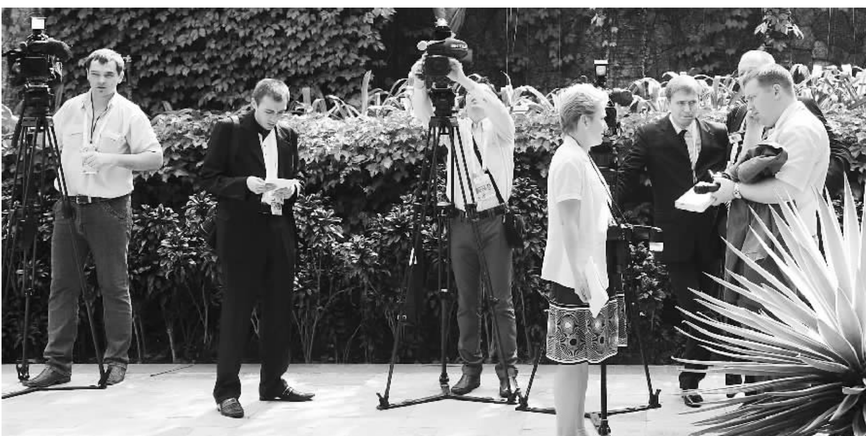
4月14日,参加金砖国家峰会的国外代表团随行记者在采访前的准备工作。

南非新闻联合社14日的文章说,金砖国家领导人峰会在全球金融体系改革、推动世界经济复苏、促进国际关系民主化等方面达成了广泛共识,成果丰硕。五国领导人表示,国际经济金融治理结构应增加新兴经济体和发展中国家的发言权和代表性。文章指出,此次金砖国家峰会还就中东、北非问题达成共识,五国愿在安理会就利比亚问题加强合作,并一致支持非盟关于利比亚问题的专门委员会提出的倡议。