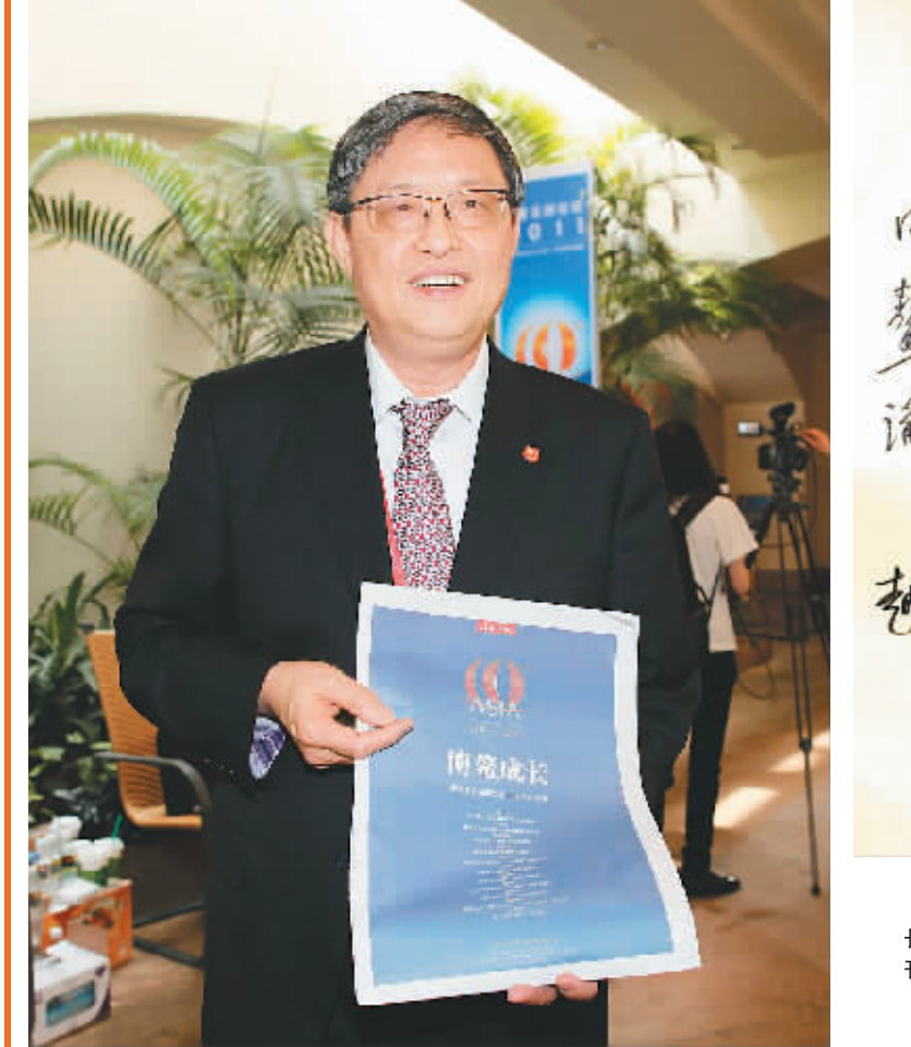
4月14日，博鳌亚洲论坛秘书长周文重盛赞海南日报《博鳌成长》特刊，并给海南日报题词。

周文重欣然提笔为本报题词：“衷心感谢海南日报十年来对博鳌论坛始终不渝地支持与帮助。祝海南日报越办越好。”