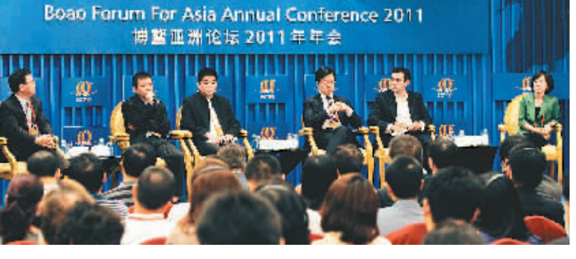
4月14日晚，博鳌亚洲论坛2011年年会举行“移动互联网的未来”分论坛。

邂逅前的另一个镜头，亚洲区域中的泰国因中央银行放弃泰铢对美元的固定汇率，泰铢疯狂贬值，直接引发一场金融风暴。风暴横扫马来西亚、新加坡、日本和韩国等地，打破了在全球独树一帜的亚洲经济高速增长图景，风暴使亚洲各国认识到，亚洲需要赶快协商对策，需要沟通、需要交流、需要合作。而最