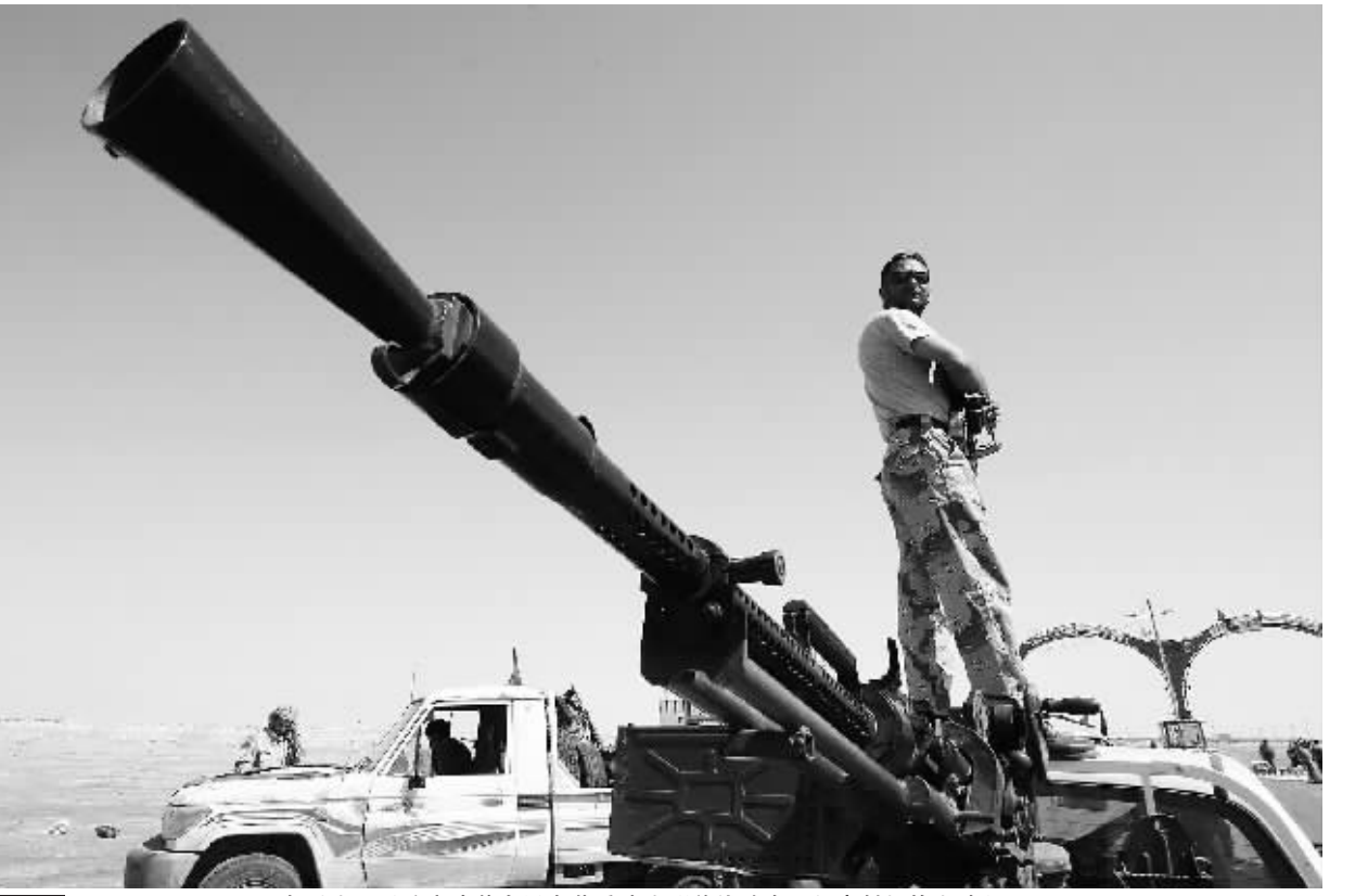
4月14日，一名利比亚反政府武装人员在艾季达比耶前线站在一门高射机枪上瞭望。利比亚副外长哈立德·卡伊姆13日晚间在首都的黎波里举行的新闻发布会上说，卡塔尔向在班加西的反政府武装提供了法国制造的“米兰”反坦克导弹。