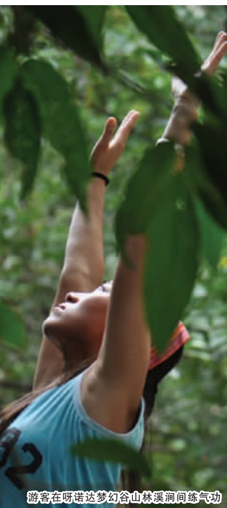
游客在呀诺达梦幻谷山林溪涧间练气功

这就是呀诺达的生活。我很羡慕景区的员工，他们每天在这神仙处所工作、生活，呼吸着最清新的空气，观看着最美丽的风景，聆听着最清脆的鸟鸣，日子快乐而写意，简单又随心。