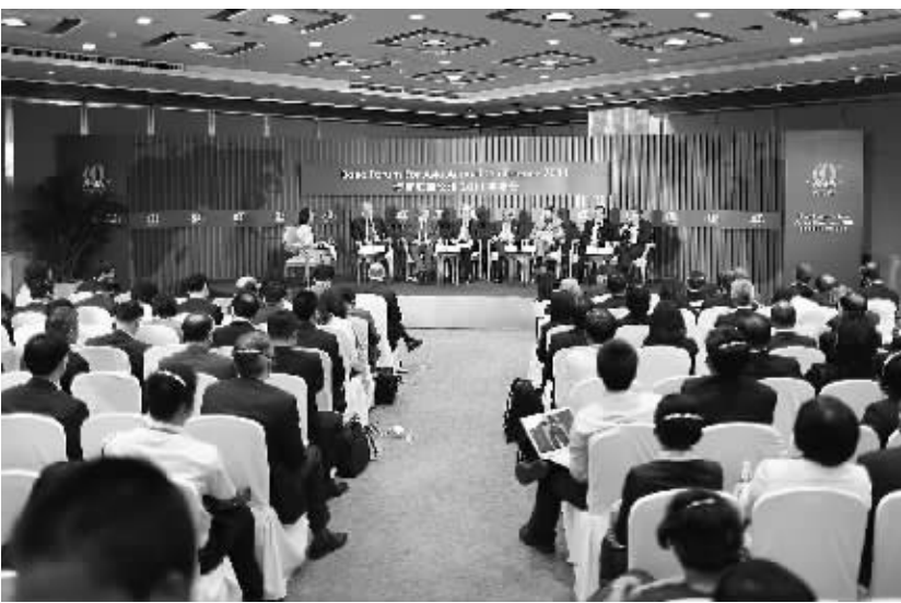
4月15日，年会举行“G20：处于十字路口”分论坛。

周小川表示，中国还会继续进行金融部门改革，包括货币的改革，推动人民币可兑换的发展，而且可以推动人民币汇率机制更加灵活。“这些事是我们想做的，而且我们要一步一步渐进式做。如果有人认为人民币应该放在SDR一揽子货币当中，我非常欢迎这种建议。”周小川说。