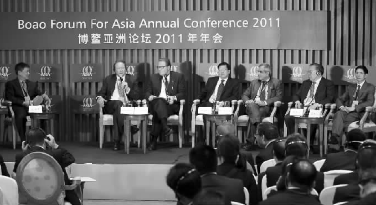
4月15日，年会分论坛“包容性发展：健康、有序的增长”在国际会议中心一层东屿宴会厅A举行。本报记者 张杰 摄

曾培炎指出，过去的全球化，包括我们的科技革命，虽然带来了文明和进步，但是并没有消除全球仍然存在的贫困和发展差距。因此下一步亚洲各国和世界各应该共同推动包容性发展。他从四个方面阐述了包容性发展的理解。他强调，我们在同一条船上，因此大家要同舟共济，把博鳌亚洲论坛建成一个促进亚洲和全球包容性发展的良好平台。