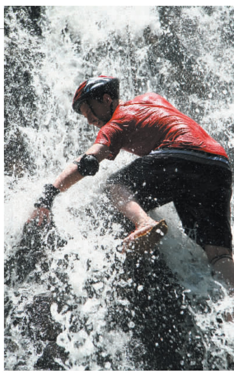
富有刺激和挑战的踏瀑戏水

植物,我们在开发时特别慎重,深怕因为我们不科学、不合理的开发,破坏了景区原有的生态环境。”景区负责人说,为了不让开发破坏环境,为了让景区与自然和谐相处,公司委托海南环境科技经济发展公司开展项目环境影响评价工作,并编制了《海南三道热带香巴拉一期项目环境影响评价大纲》和《海南三道热带香巴拉一期项目环境影响报告书》,大气环境、水环境、声环境、植被等等,都是严格按照国家一级标准来执行的,这个高标准《环评大纲》于2005年9月通过了省国土环境资源厅组织的环评。在通过环评后,公司才着手开发景区。