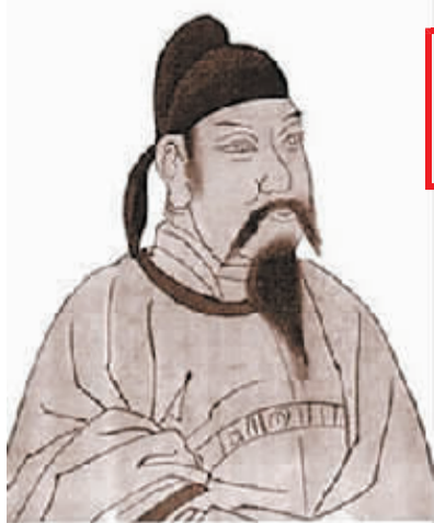
南唐后主李煜画像