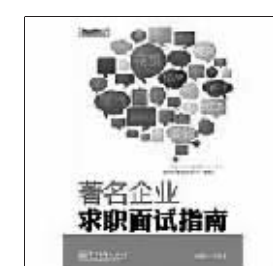
作者：郭晓博 电子工业出版社 2011年3月

这是一本从美苏视角来解析冷战的著作，它聚焦于冷战的两个主角，追溯19世纪后半叶的历史纠葛，及2006年的两国关系，论述了冷战的缘起、演变、结束以及对今日美俄关系的影响。