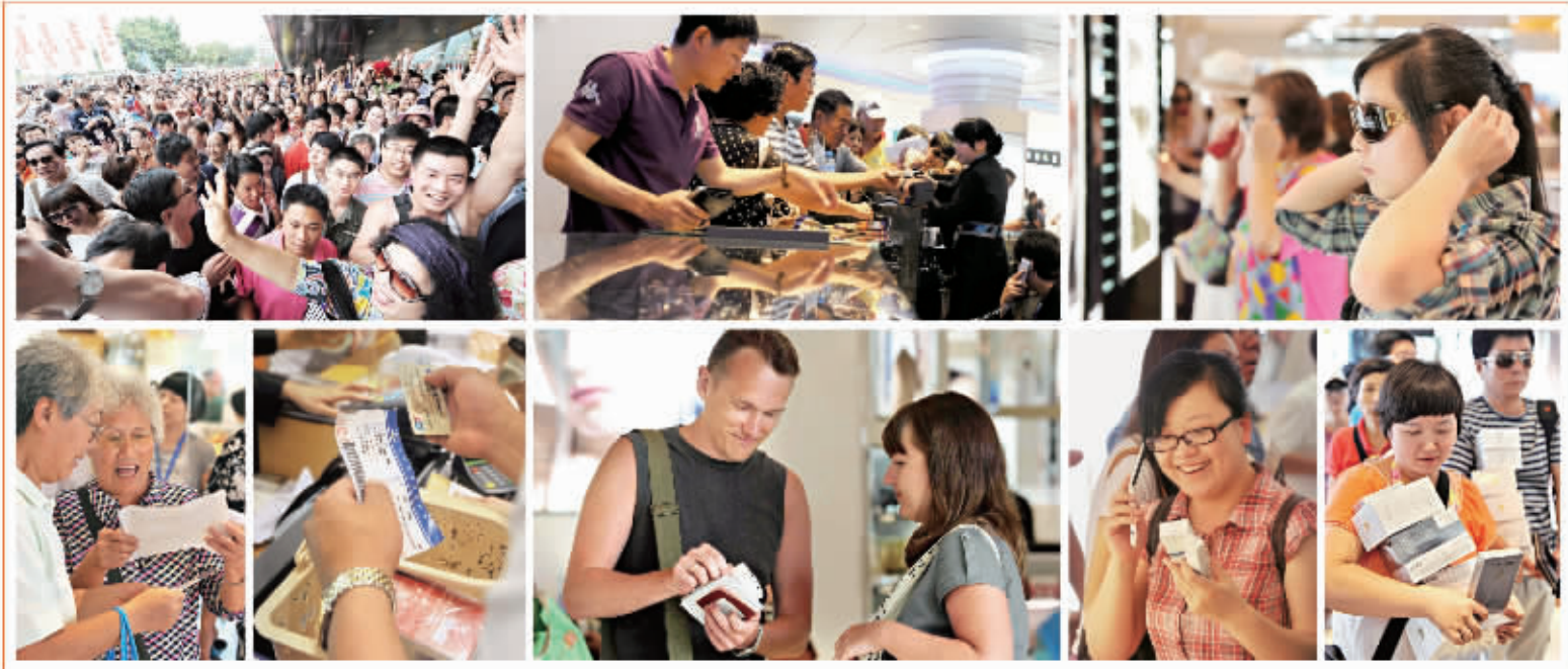
4 月 20 日，海南离岛旅客免税购物政策试点实施后，立即激发出岛内旅客的购物热情。