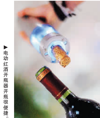
▶电动红酒开瓶器开瓶很便捷。