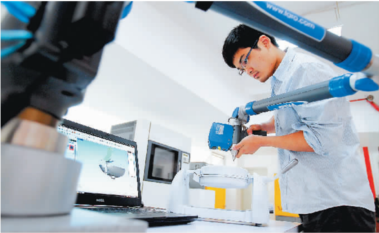
▲创意港工作人员正在用三维扫描仪记录物体的三维数据。