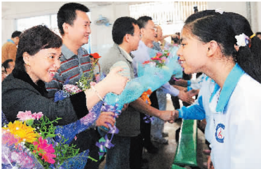
4 月 23 日上午,共青团海口市委和共青团青少年宫以及社会爱心人士,带着乐器、学习用品、食品等,来到海口市特殊教育学校慰问该校师生,并为师生们表演节目。 本报记者 古月 摄