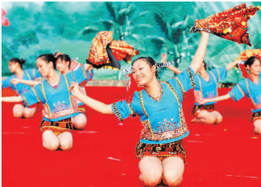
白沙民族歌舞团的演员们在排练黎族舞蹈《双面绣》。

一个自己创作的节目叫做《白沙鼓韵》,为了创作,演员深入细水乡自村驻队 2 个多月,白天帮着村民割稻谷,晚上就向他们学习黎族鼓的打法,研究其特点。《白沙鼓韵》最终获得全省少数民族文艺会演一等奖。