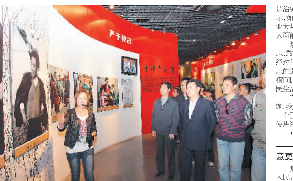
人们在焦裕禄纪念馆参观(4月14日摄)。每年5月14日,河南省兰考县焦裕禄墓园都汇聚着来自四面八方的人们。大家怀着同一个心愿:再看看党和人民的好干部焦裕禄。这一天是焦裕禄逝世纪念日。

采访中,记者听说这样一件事:因为一部有关焦裕禄的长篇电视剧拍摄需要,导演提出要在当地找一处大片的沙荒地,再现兰考当年“三害”肆虐的情景。这让当地人很是为难:“上哪儿去找呀?兰考现在真是没有大片大片的沙荒地了。”