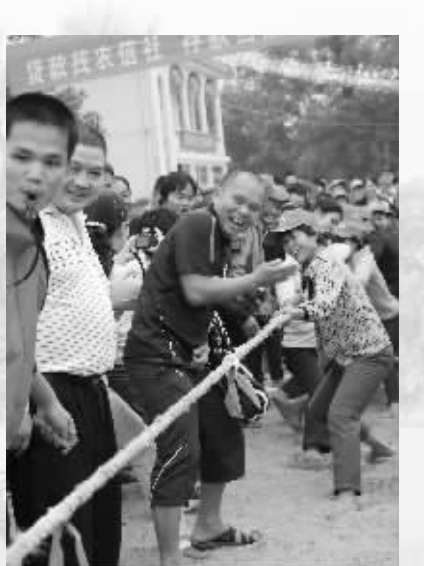
群众文化生活丰富多彩

岁月悠悠，时光荏苒，1931年，红色娘子军在这里诞生，80年过去，弹指一挥间，在党的光辉照耀下，这块红色的土地发生了翻天覆地的变化。举目望明日，前程似锦。在党的旗帜指引下，这块神奇的土地将变得更加灿烂，变成老区人民幸福满满的乐园。