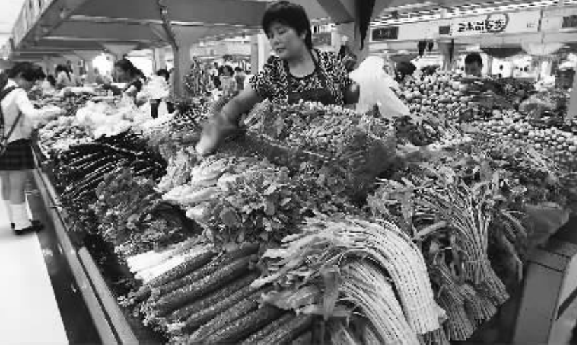
上海一家标准化菜场的摊贩正在摆放蔬菜。5月11日,国家统计局发布的数据显示,4月份我国CPI同比上涨5.3%,比3月份的5.4%略有回落。

中国人民银行4月金融统计数据报告显示,4月份狭义货币(M1)同比增长12.9%,比上月和上年同期分别低2.1和