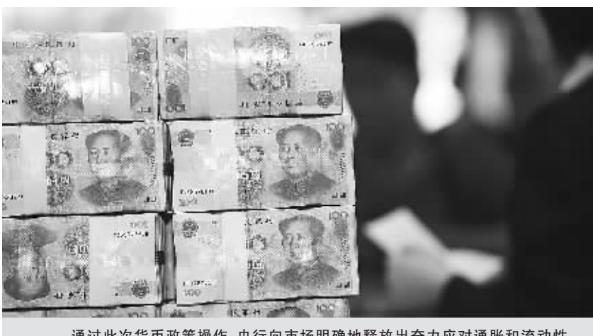
通过此次货币政策操作,央行向市场明确地释放出对通胀和流动性过剩的政策信号。

中国人民银行12日宣布再度上调金融机构存款准备金率0.5个百分点,这是央行今年以来第五次上调存款准备金率。值得注意的是,就在当天央行还重启了暂停5个月之久的3年期央票发行。作为具有一定替代作用的两大货币工具,央行在同一天同时启动,令市场略感意外。通过此次货币政策操作,央行向市场明确地释放出对通胀和流动性过剩的政策信号。从4月份的数据来看,当前通胀压力确实并没有明显缓解迹象,并且市场预期未来几个月物价走势还会保持高位,抗击通胀可能会成为一场持久战。在处理保持经济平稳增长和稳定物价二者间关系上,央行正在把抑制通胀、控制流动性放在稳定经济增长之前,作为当前的首要矛盾来用。