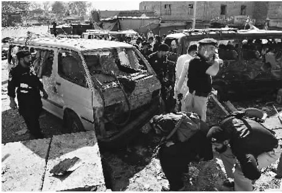
5月13日，安全人员查看自杀式炸弹爆炸现场。

巴基斯坦西北部地区一处准军事警察训练中心13日遭遇自杀爆炸袭击，70多人死亡，80多人受伤。