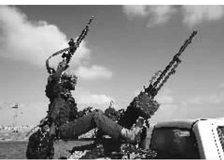
5月12日，在利比亚东部城市艾季达比耶市郊，反对派武装人员从前线归来。艾季达比耶市中心当日上午遭到火箭弹袭击，这是时隔20多天后该市再次遭到袭击，所幸没有造成人员伤亡。