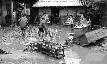
5月13日，在越南老街省，居民清理泥石流造成的淤泥。越南老街省的多个县市12日遭受山洪和泥石流灾害，造成上百间民房倒塌，多处道路和桥梁被毁。