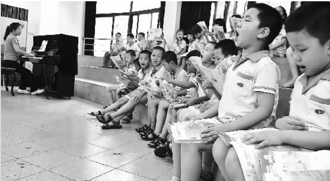
音乐课堂上孩子们伴着老师的钢琴声放声高歌。通过开设各种特色班，让学生的个性和特长得到健康地发展。