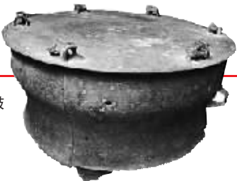
海南出土汉代铜鼓