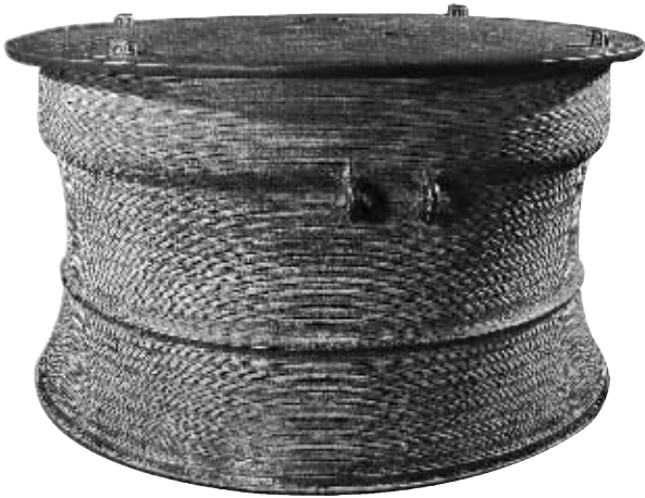
昌江十月田出土的汉代北流型铜鼓

铜鼓千千万面,面面皆不同。 作为一种青铜重器,铜鼓因形体巨大,而鲜见于民间收藏,而随着收藏日益升温,铜鼓逐渐开始被各路藏家所重视。 目前已知海南出土铜鼓中,以昌江黎族自治县十月田镇出土的汉代北流型铜鼓为体积最大者,现藏于省博物馆。此外,省博物馆还入藏两面临高县出土的汉代北流型铜鼓,体积稍小。