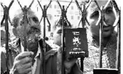
这张资料照片显示的是巴勒斯坦人拿着护照在加沙南部等待通过拉法口岸进入埃及(2009年11月2日摄)。