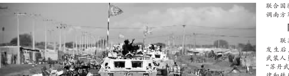
5月24日,联合国维和部队在苏丹中部阿卜耶伊的大街上巡逻(资料照片)。

围绕阿卜耶伊问题,苏丹北南之间再次剑拔弩张。苏丹北方政府近日在其部队遭遇南方军队袭击后,出兵占领了位于苏丹北南分界线中部的阿卜耶伊地区。