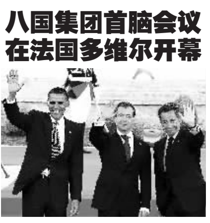
八国集团首脑会议26日在法国西北部海滨小城多维尔开幕。根据会议议程,与会首脑将就阿拉伯国家局势、非洲发展和互联网三大主题展开交流磋商。