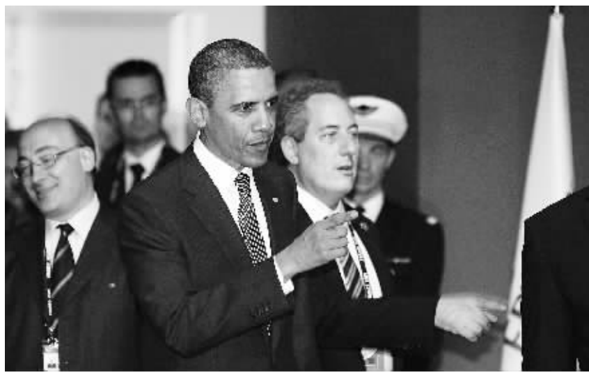
5月26日,美国总统奥巴马出席在法国西北部海滨城市多维尔举行的八国集团峰会。