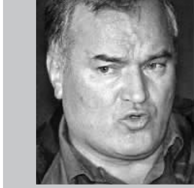
姆拉迪奇在法庭上的照片。