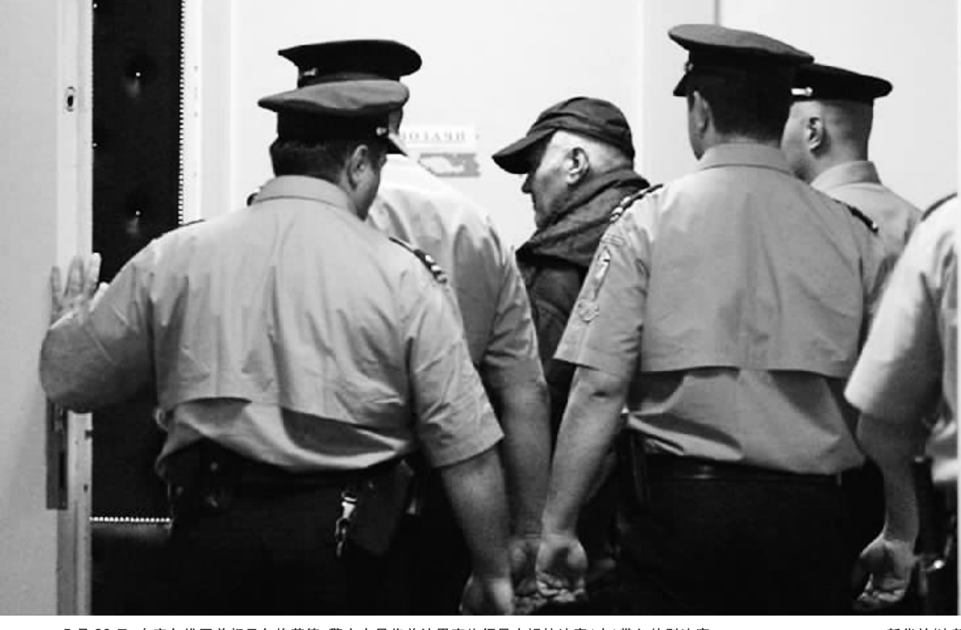
5月26日,在塞尔维亚首都贝尔格莱德,警方人员将前波黑塞族领导人姆拉迪奇(中)带入特别法庭。