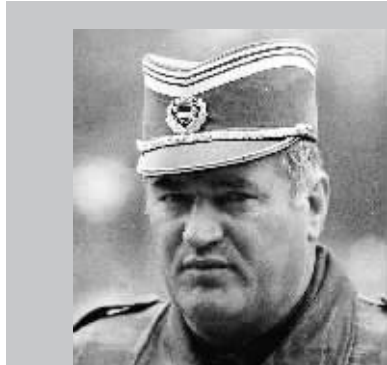
1993年5月7日拍摄的姆拉迪奇的照片。

一名警方官员告诉路透社记者,抓捕行动中,姆拉迪奇没有反抗,“他戴上铐,被迅速带走”。