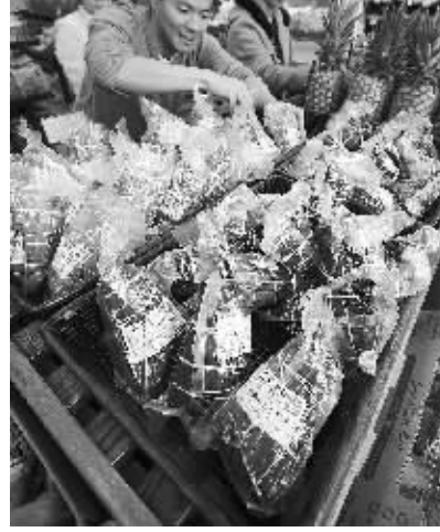
5月30日,售货员在美国旧金山湾区一家新开张的华人超市里摆放粽子。