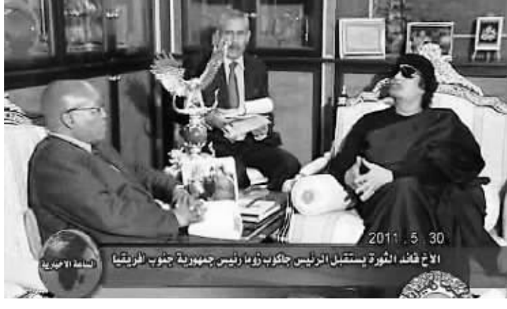
利比亚国家电视台五月三十日播出的领导人卡扎菲(右)会见南非总统祖马(左)的视频截图。

综合新华社的黎波里5月30日电 南非总统祖马30日在对利比亚进行短暂访问时宣布,利比亚领导人卡扎菲已接受并准备执行非洲联盟(非盟)提出的旨在解决利比亚危机的“路线图”计划。