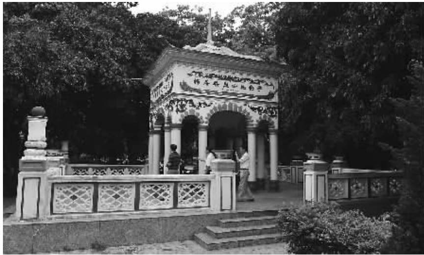
琼海市嘉积镇的善集园建有杨善集烈士纪念馆以及其与夫人林一人的烈士墓。