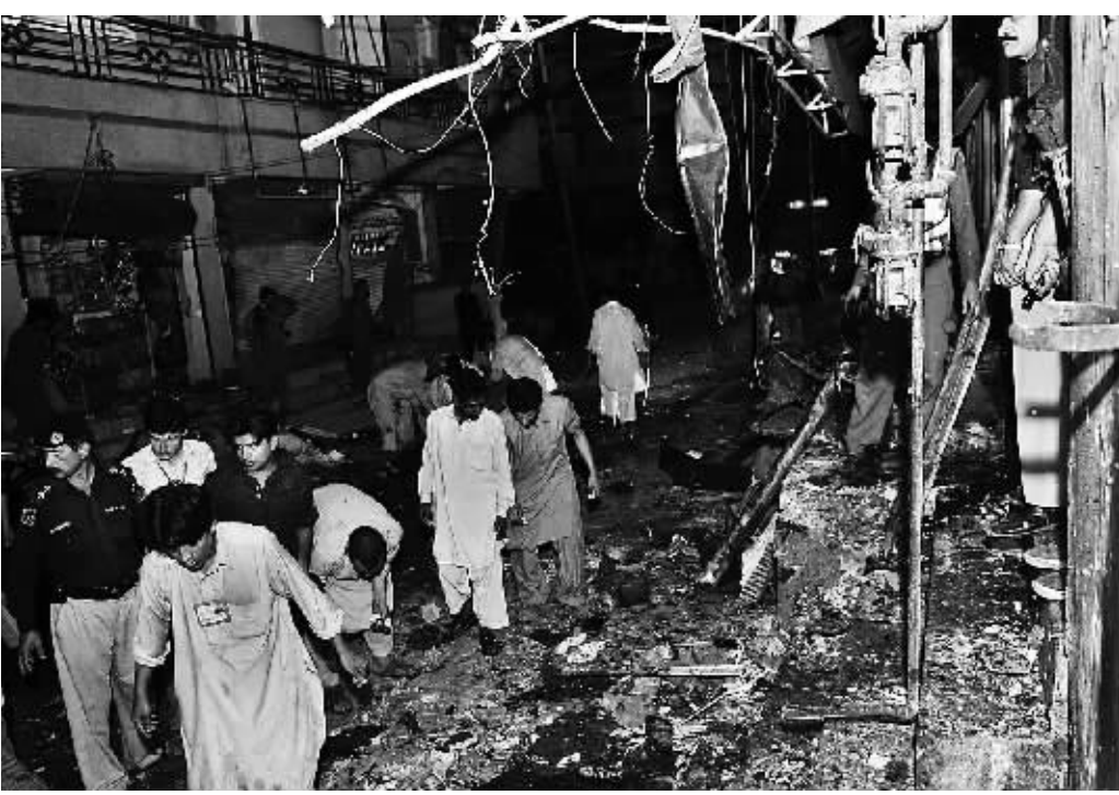
6月12日凌晨,在巴基斯坦白沙瓦,警察和志愿者在炸弹爆炸现场搜救。