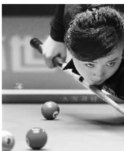
世界9球中国公开赛 付小芳夺冠 12日,在世界9球中国公开赛女子组决赛中,付小芳以9:3战胜同胞陈思明,夺得冠军。图为付小芳在决赛中。

12日,在世界9球中国公开赛女子组决赛中,付小芳以9:3战胜同胞陈思明,夺得冠军。图为付小芳在决赛中。