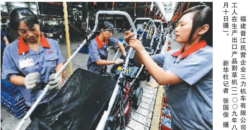
福建晋江民营企业三力机械有限公司工人在生产出口产品制草机。