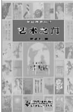
《艺术之门》(北京师范大学出版社出版) 2011年1月

在三十年专业设计之余，耀世先生为了促进设计事业的发展 and 书画界、工艺美术界创作的繁荣，撰写、发表了大量杰出艺术家的评论，对提高美术编辑、设计工作者的专业水准，向广大读者普及艺术欣赏知识，起到了很好的作用。收入此书三辑中的艺术评析文章，只是他精心选编的一部分。他苦心收集评点的设计、绘画、工艺美术佳作图例，品位上乘、蔚为大观。有不少佳作会令你陷入思索难以忘怀，或是眼前一亮，灵感闪现……《艺术之门》已由北京师范大学出版社出版，这确是对从事艺术专业的学子们有用的一本好书。■