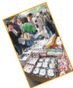
首尔街头的小摊上,经常会看到做工精致的钢制筷子、勺子和带盖的小碗。