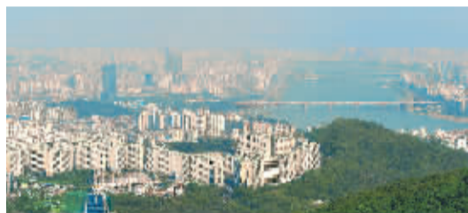
在首尔塔望远首尔。

据记载,朝鲜半岛新罗时代、高丽时代,发酵食品(腌制食品)的技术已经很流行,并不断改进。在当时,泡菜是以萝卜为主原料的泡萝卜、咸菜、酱菜。而今天以白菜和红辣椒面为主要原料的辣白菜,是白菜和辣椒从中国传到朝鲜后开始普及的。我们在泡菜学校里看到,制