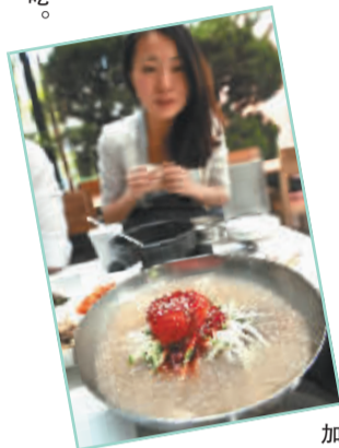
加了冰的韩国冷面。