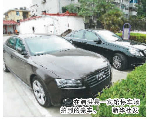
在泗洪县一宾馆停车场拍到的豪车。