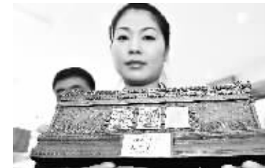
7月22日，邮局工作人员展示《国瓷·大龙邮票》。

据新华社天津电 (记者周润健)为纪念中国第一套邮票“大龙邮票”发行133周年，天津市集邮公司22日推出了《国瓷·大龙邮票》。