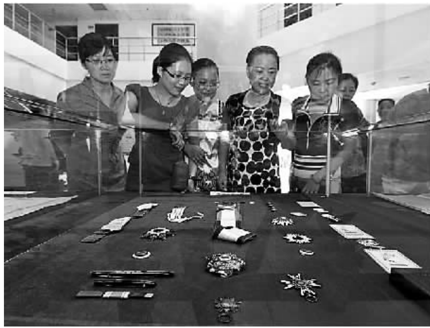
7月22日上午，陈策将军档案资料捐赠仪式在省档案馆举行，图为群众观看陈策将军珍贵档案资料。

本报讯 (记者徐珊珊)3枚纪念中国人民抗日战争胜利60周年纪念章、6页战时简报、68页战时日记……7月22日，陈策将军档案资料捐赠仪式在海南省档案馆举行。