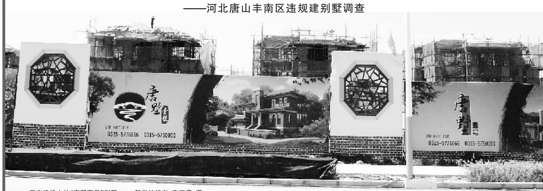
正在建设中的“唐墅壹号”别墅。

“唐墅壹号”——河北省唐山市丰南区一个在建的高档独栋别墅区。近年来,国家多次下令禁止建别墅,为什么这样一个别墅项目还能堂而皇之地矗立直上呢?