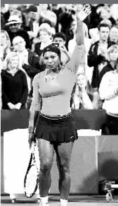
7月31日,在美国斯坦福举行的WTA西部银行精英赛单打半决赛中,小威廉姆斯以2比0战胜德国选手利斯基,晋级决赛。