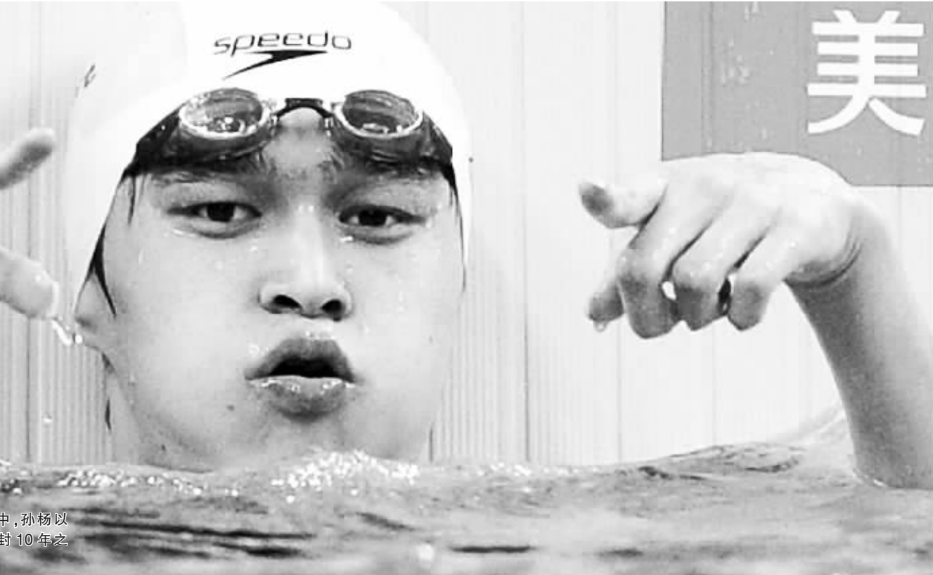
7月31日,在男子1500米自由泳决赛中,孙杨以14分34秒14的成绩夺得冠军,并打破了尘封10年之久的世界纪录。