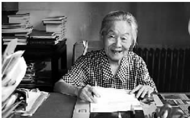
世纪老人杨绛先生

7月17日,杨绛先生百岁寿辰。这位世纪老人,保持了她一以贯之的低调——谢绝媒体采访和庆祝仪式,亲友只要“在家替我吃了一碗寿面就好了”。然而媒体和大众依然保持了足够的热情——专题遍布大小报刊、杂志和网站,微博上热情的祝福涌动,使这位最不喜热闹百岁老人的名字成为了最热门的词汇。纵观杨绛先生百岁历程,她的家世、爱情、著作、品格等,都变得稀有而不可得。我们在先生百岁诞辰的时候,回顾她的人生,是愿她朴素清澈的光辉,洒满更多尘世的道路。