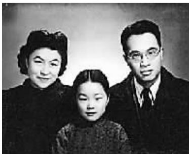
杨绛(左)、钱锺书与女儿一家三口合影