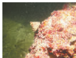
加井岛周边的海底保护得很好。