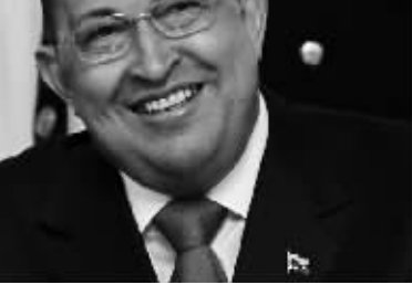
8月1日,在委内瑞拉首都加拉加斯的总统府米拉弗洛雷斯宫,查韦斯以新发型亮相内阁会议。查韦斯在古巴接受癌症化疗后剃了头发。委内瑞拉政府和查韦斯本人迄今没有说明他所患癌症类型。