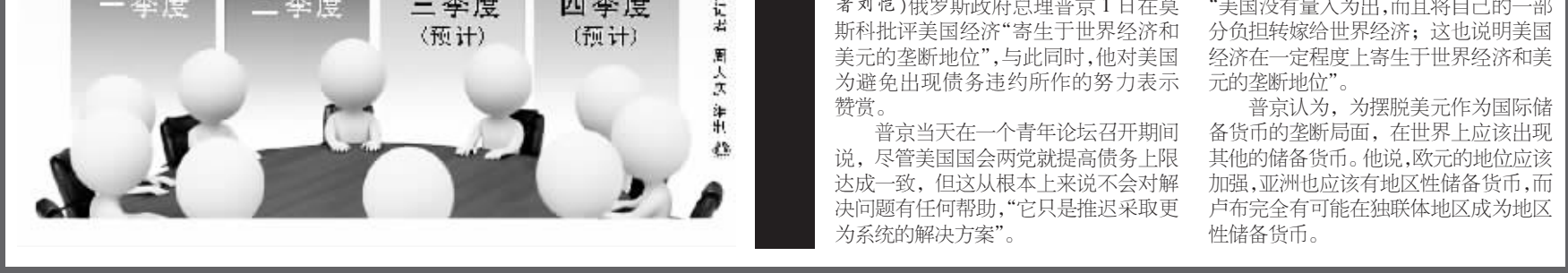
美财政部预计第三季度大幅增加发债 美国财政部发债规模(净净销债务) 2011年 单位:亿美元

据美国会预算局的数字,当天通过的法案内容包括:提高美国债务上限至少2.1万亿美元,并在十年内削减赤字2.1万亿美元以上。法案分两步执行,第一步先提高债务上限9000亿美元,在十年内削减赤字9170亿美元。