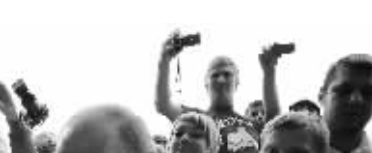
8月2日,俄罗斯在首都莫斯科的红场上举行“空降兵日”活动,纪念俄空降兵部队诞生81周年。