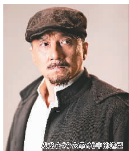
成龙在《辛亥革命》中的造型

据新华社北京8月2日电（记者白瀛）辛亥革命百年献礼影片《辛亥革命》将于9月上映。对成龙而言，这部影片有着十分重要的意义，他不但在此片中担任导演之一，还是他从影以来参演的第100部电影，也是他首次演一个真实存在的历史人物。