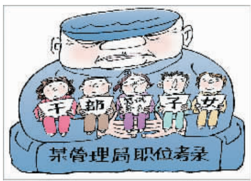
“入围” 新华社发 蒋新 作