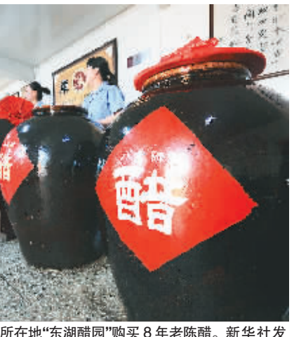
人们在山西老陈醋集团所在地“东湖醋园”购买8年老陈醋。

邓海华说,近期发生的味千“骨汤”拉面、肯德基豆浆粉以及山西“陈醋勾兑”等食品事件,性质并不完全相同。有的涉及企业是否诚信经营,有的是公众对于企业食品生产的认识问题,还有一些是对食品添加剂的认识问题。