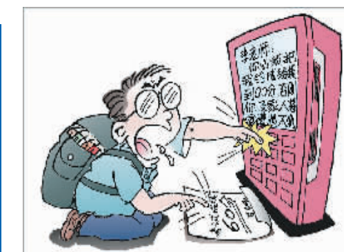
最后的“分”狂 新华社发 蒋新 作

在回应网友部分低分考生为何能进入面试,朱常明给出的解释是,有的岗位符合条件的报考人员只有3个人,入围人员只能从高分到低分取。