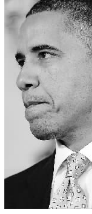
8月8日，奥巴马就标普下调美国主权信用评级对媒体发表讲话。

美国总统贝拉克·奥巴马8日在白宫召开新闻发布会，就美国主权信用评级下调发表讲话。