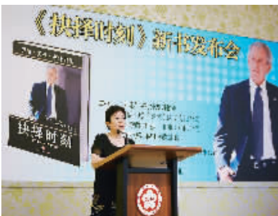
8月10日,中国人民对外友好协会副会长李小林在发布会上介绍新书《抉择时刻》。

作为中国民间外交的重要推手,中国人民对外友好协会(友协)为推动中美两国之间的交往作出了重要贡献。友协副会长李小林认为,《抉择时刻》一书真实反映了布希的自我,非常感人。