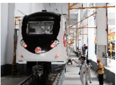
8月10日,工作人员在对抵达的首列地铁车辆进行巡检。

杭州地铁1号线车辆一列有六节车厢,额定载客能力为1436人。车辆最高运行速度为80公里/小时,全线平均运行速度不小于37公里/小时。预计杭州地铁1号线主线铺轨将在今年国庆前完成。