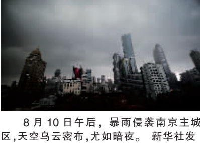
8月10日午后,暴雨侵袭南京主城区,天空乌云密布,尤如暗夜。