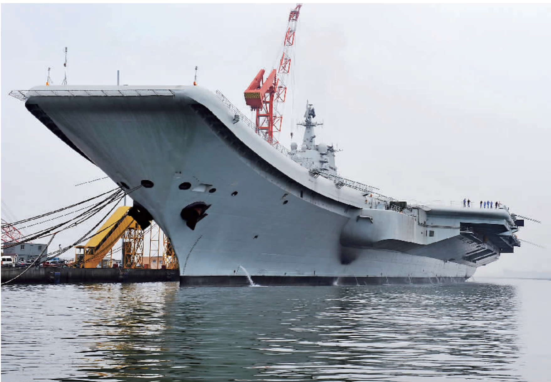
8月10日,中国航母平台进行出海航行试验。按照试验计划,首次出海试验时间不会太长,返回后将继续在船厂进行改装和测试工作。图为拍摄于大连的中国航母平台。