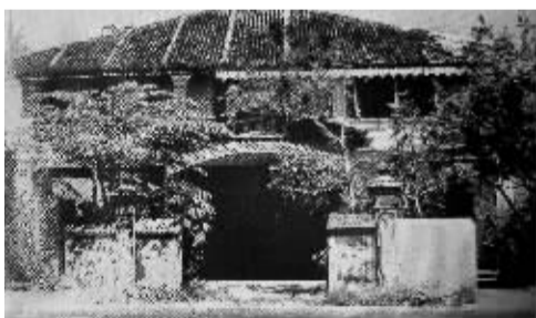
孙中山在檳城的寓所，也是庇能会议的地点。

王斧曾在新加坡《中兴日报》主持笔政，与保皇派笔战，文笔犀利，并主张武装斗争，为星洲政府所忌，不能继续在新加坡活动，于1907年离新赴泰国。王斧离开后，同盟分会的组织工作由王汉光等负责，并积极开展活动。为避免英政府的限制与迫害，王汉光、符国良、陈毓卿、张志华、王汉文、符爱国等于1907年又在新加坡二马路创设“大同阅报处”，作为继续从事革命活动的机关，加盟者由十几人增加至200余人，连马来亚芙蓉埠的琼籍侨领袖