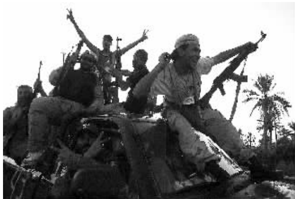
利比亚反对派武装乘坐汽车向的黎波里郊区进发。