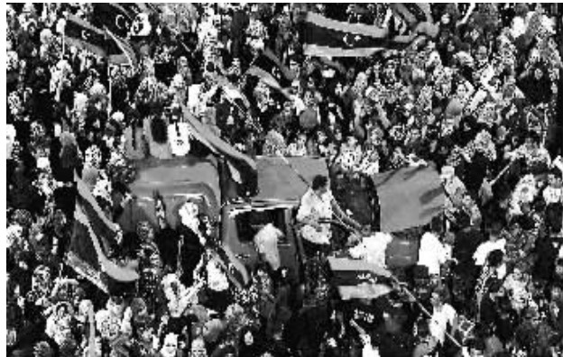
民众庆祝反对派武装进入首都的黎波里。