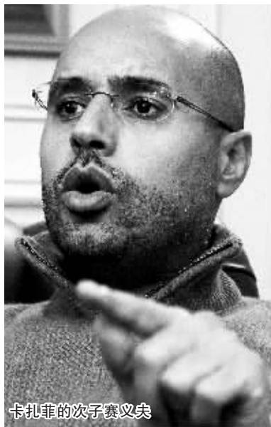
卡扎菲的次子赛义夫