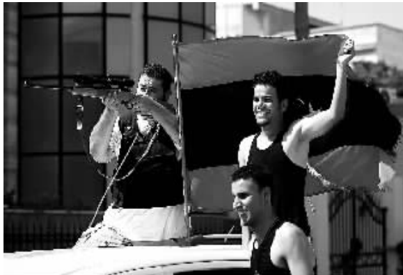
反对派武装人员在首都的黎波里的街道上庆祝。