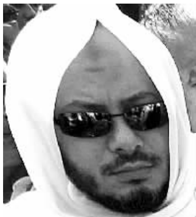
卡扎菲长子穆罕默德