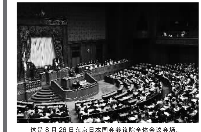
这是8月26日东京日本国会参议院全体会议会场。

2010年6月2日,时任首相、民主党党首鸠山由纪夫因就美军普天间基地搬迁事宜进退失据,与同样卷入政治献金丑闻的民主党干事长小泽一郎“捆绑”辞职。民主党“三驾马车”仅存的副首相兼财务大臣菅直人同月4日接替鸠山。菅直人是日本多年来第一位出身普通工薪家庭、而非“蓝血”政治世家的首相,誓言开创没有政治献金丑闻的“清廉政治”,帮助日本“摆脱政治僵局”,民众给予他不小的期望,内阁民意支持率从鸠山内阁末期不足两成反弹至60%以上。民意反复使菅直人内阁产生错觉和自满情绪,希望趁热打铁举行参议院选举,力图单独控制参院半数以上席位,因而没有与在野党协商,单方面提前结束国会会期。然而,民主党参议院竞选纲领与2009年众议院竞选纲领出入较大,尤其在高速公路收费、育儿补贴等民生政策方面出尔反尔,使原本对民主党颇有期待的选民大失所望。菅直人以重建财政为由,数次提议上调消费税,却没有作充分解释,把不少选民推向自由民主党等在野党怀抱。菅直人竞选党首时得到鸠山和小泽支持,出任首相后却开始走“脱小泽”路线,启用以批评小泽政治献金丑闻而著称的仙谷由人担任内阁房长官,依靠前原诚司、枝野幸男等少壮派派系,排斥“小泽派”,埋下党内对立的地雷。 胡若愚(新华社供本报特稿)