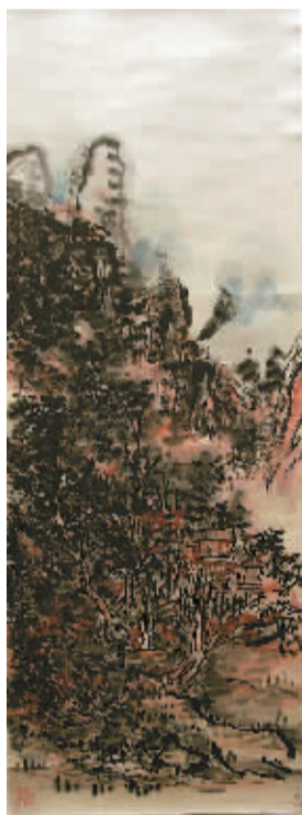
黄宾虹展出作品系列

持续一个月的《二十世纪中国书画大师作品系列展·黄宾虹》本月21日在海南省博物馆落下帷幕。这是省博物馆20世纪中国书画大师作品系列展览中第一位展出的大师，也是今年奉献给海南观众的十大展览之一。画展精选了浙江省博物馆珍藏的黄宾虹山水画作品40幅，连日来，前来省博物馆观摩欣赏的不仅是书画界人士，还有慕名前来观展的市民和学生。难得一见的大师原作在海南展出整整一个月，这不能不说是海南文化生活中的一大盛事。