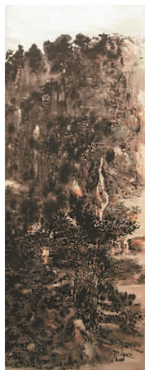
黄宾虹展出作品系列