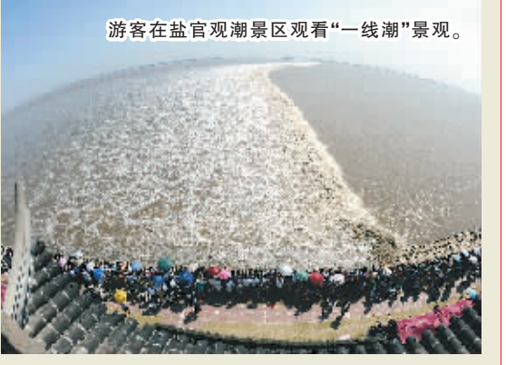
游客在盐官观潮景区观看“一线潮”景观。

9月15日是农历八月十八,是每年观看钱塘江大潮的最佳时机。钱塘江大潮号称“天下第一潮”,有“八月十八潮,壮观天下无”的名句,每年都会吸引数十万中外游客聚集在钱塘江沿岸守候观看“一线潮”“回头潮”等壮观景象。