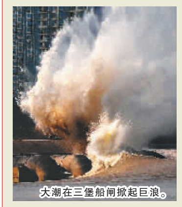
大潮在三堡船闸掀起巨浪。

新华社北京9月15日电 国务院任免国家工作人员。任命韩文秀为国务院研究室副主任;任命陈文辉为中国保险监督管理委员会副主席;任命陈方磊为国有重点金融机构监事会主席;任命于革胜、沈小南(女)为全国社会保障基金理事会副理事长。免去于再清的国家体育总局副局长职务;免去魏迎宁的中国保险监督管理委员会副主席职务;免去魏礼江的国有重点金融机构监事会主席职务。