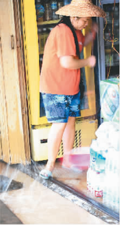
9月20日下午的暴雨之后,三亚榆亚大道一带(见上图)冲积了大量泥沙垃圾,直至今天下午仍未清扫,严重影响了城市卫生。右图为21日下午,南边海路某小商店妇女仍在扫水,昨天她的商店一度成了汪洋。据她反映,该路段排水管道堵塞两年无人疏通。