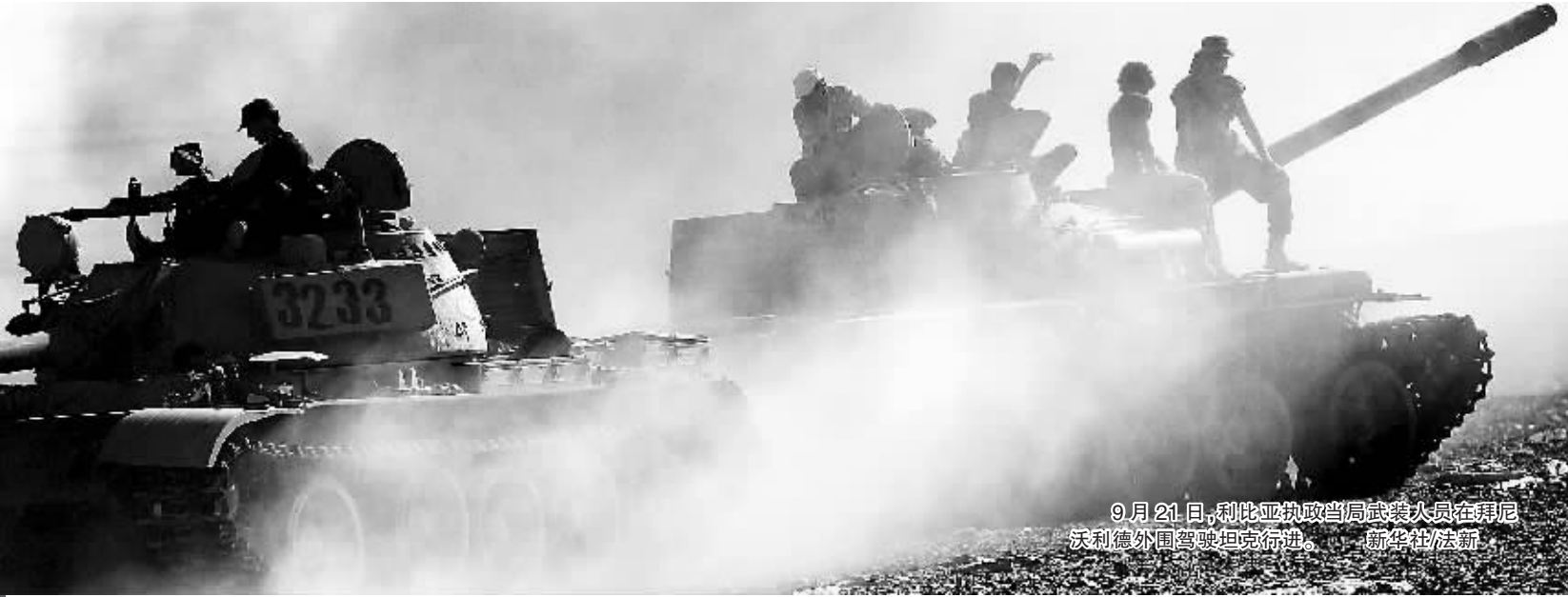
9月21日,利比亚执政当局武装人员在拜尼沃利德外国使馆附近行进。

据新华社伦敦9月20日电(记者黄斐)许多人吸烟后都发现自己的记忆力有所下降,而英国一项研究显示,如果戒烟,记忆力就可以得到一定程度的恢复。 英国诺森比亚大学20日发布公告说,该校研究人员对一些志愿者进行了记忆测试,这些志愿者包括吸烟者、戒烟者和从不吸烟者。他们被要求在校园中的一些指定地点完成预先交代的一系列任务。 结果显示,吸烟者群体的记忆力表现最差,平均只能记起59%的任务;而不吸烟的群体表现最好,平均能记起81%的任务。那些已经戒烟者也有较好的表现,平均能记起74%的任务。