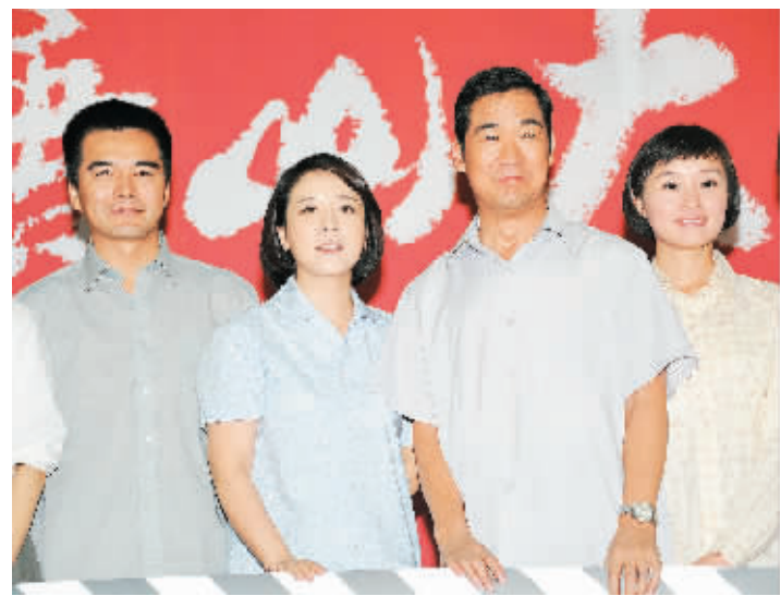
9月20日,电视剧《唐山大地震》主演许亚军、陈小艺、张国立、吴越(左起)出席记者会。

本报讯 根据小说《余震》改编的40集电视剧《唐山大地震》日前在北京举行开机发布会,各位主演均着戏中服装亮相。在发布会现场,陈小艺、张国立等主演均以电影版中的演员名字来介绍自己在剧中所扮演的角色。如此方式一是方便让大家在第一时间就对号入座,二是也足以感受