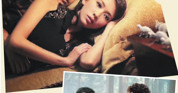
《幸福额度》 林志玲、陈坤 剧照