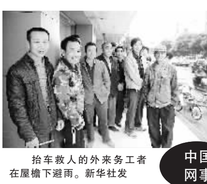
抬车救人的外来务工者在屋檐下避雨。

10月19日下午3时,南昌市广场东路上发生一起交通事故,一名女孩被一辆蓝色别克轿车压在车底,情况十分危急。此时,20多个正在附近等活的外来务工人员闻讯立即冲上来抬车救人,由于救援及时,受伤女孩得到及时救治。 此事经网民发帖传播后,迅速在网络上引发强烈反响,不少网民对这种人间真情所温暖和感动,并急切地想知道具体情况。为此,新华社“中国网事”记者采访到当事人,了解到了当时感人至深的救人场景。 记者了解到,事件当日的15时55分,网贴《南昌人硬生生抬起汽车,救下车轮下的女孩》被首先发出,在短短几个小时里,就被点击上万次,有数百人回帖。 此后,该事件又被国内各大网站、微博迅速转发,成为一大社会热点。 19日18时,在事件发生后三个小时,记者根据网站信息,来到收治女孩的医