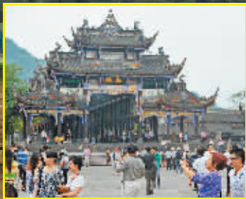
都江堰景区门口南桥独特的建筑物。

站在护栏旁朝宝瓶口望去,滚滚岷江水夹杂着“轰隆声”顺势奔涌不止,但它们一到了宝瓶口就好像变乖似的,水速骤然变缓流向成都平原。在飞沙堰,不同形状的石头和许多泥沙躺在溢洪道上,延续着两千多年来既能减少泥沙在宝瓶口周围的沉积、又能减缓水速的功能。在鱼嘴分水堤,十几只白鹭正在奔涌不息的岷江水面上戏水,有几只白鹭累了就在鹅卵石上小憩或踱步,一副闲情逸致的姿态。