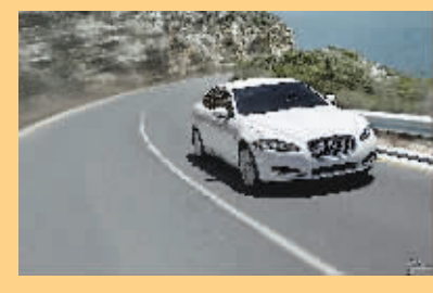
捷豹路虎九月销量破纪录 前三季度连创佳绩

【本 报 讯】记者日前从世界顶级豪华品牌捷豹路虎中国授权经销商海南中汽南方获悉,截至第三季度,捷豹路虎在华销量再创新高,九月份销量打破同期纪录,前三季度连续收获出众表现。其中,9月份单月销量迅猛增长,同比增幅高达 92%;第三季度销量同比增长达到 87%,共交付 10869 辆汽车,开创季度销售纪录新高。至此,捷豹路虎一举突破了去年全年的销量,交付 29377 辆汽车,1 至 9 月销量和去年同期相比显著增长 60%。捷豹路虎以强劲业绩增幅领先中国豪华汽车市场增长。